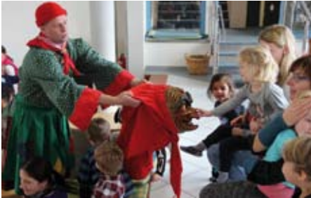
Doch der ein oder andere ließ sich prompt dazu überreden, die Maske selbst aufzuziehen.