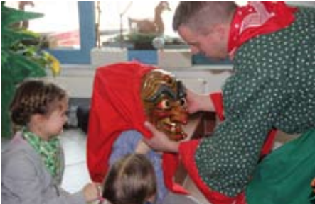
Auch die Großen aus der Krippe waren gekommen, um das Spektakel mutig mitzuerleben.