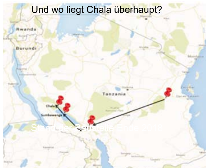
Und wo liegt Chala überhaupt?