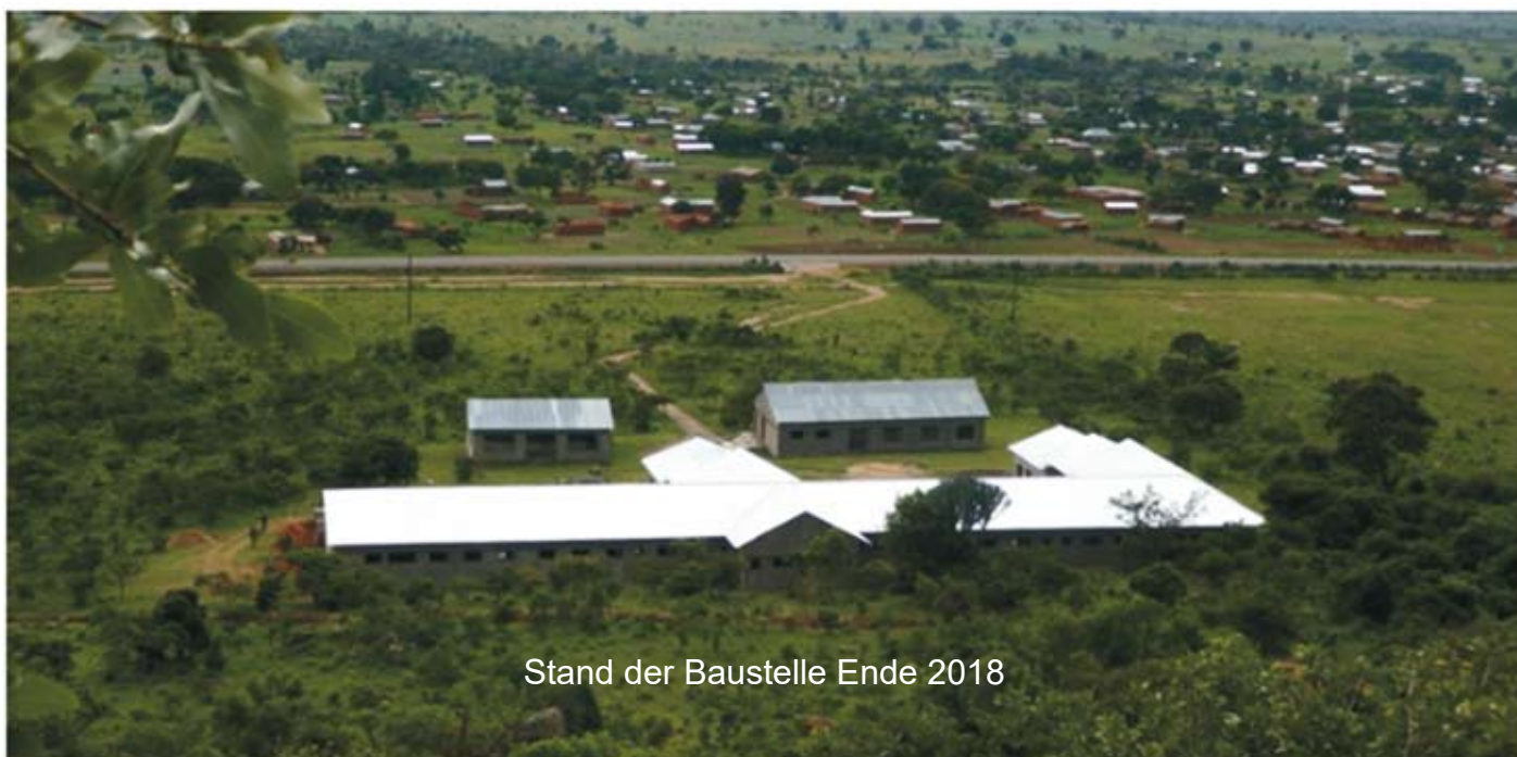
Stand der Baustelle Ende 2018