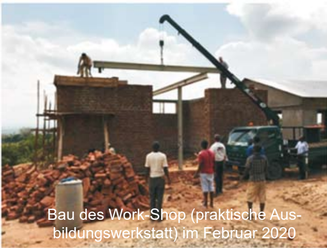
Bau des Work-Shop (praktische Ausbildungswerkstatt) im Februar 2020

Transporter Chala Bauteilart: 1 Grundriss: 1/100