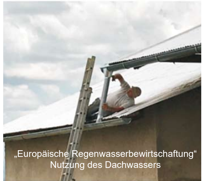
„Europäische Regenwasserbewirtschaftung“ Nutzung des Dachwassers