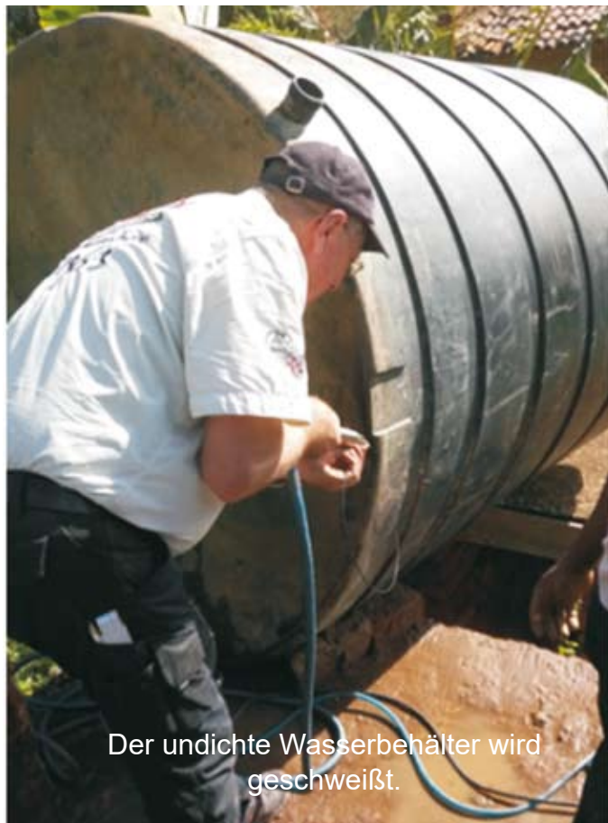
Der undichte Wasserbehälter wird geschweißt.