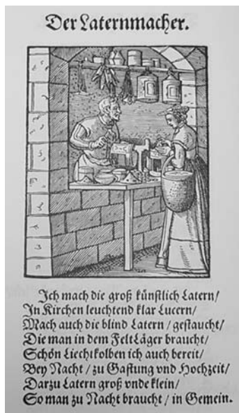
Bild 2: Der Laternenmacher. Holzschnitt aus Jost Amman, Das Ständebuch. Leipzig, Insel-Verlag, 1989

beschreiben, stammen zum Teil von Hans Sachs . Darin heißt es, dass der Laternenmacher von den ganz hell leuchtenden, großen Laternen für Kirchen, über „Lichtkolben“ für Gasthäuser und Hochzeiten sowie Laternen für den Haushalt, bis zu den „blinden“ Laternen, die in den Feldlagern des Militär gebraucht wurden, alles herstellen konnte.