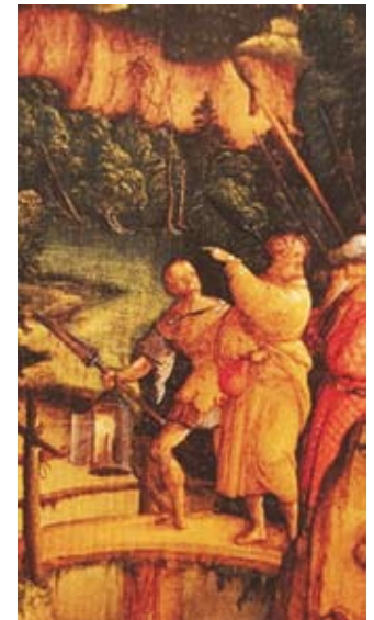
Der Knecht des Hohepriesters trägt eine Blechlaterne.

Obwohl die gemalte Laterne nur ein kleines Detail des Gemäldes ist, lässt sich doch erkennen, dass sie dem tatsächlichen Gegenstand ganz genau nachempfunden ist. Aus unserer Perspektive heißt das, dass wir sicher sagen können, dass solche Laternen in unserer Gegend in der ersten Hälfte des 16. Jahrhunderts in Gebrauch waren und, weil die gemalte und die „echte“ einander so ähneln, dass sie möglicherweise in bestimmten, größeren Städten von spezialisierten Handwerkern in größerer Anzahl hergestellt worden sein müssen. Oder aber (und das ist natürlich nicht ernst gemeint), dass der Meister von Meßkirch sich in Bräunlingen die Laterne zum Abmalen ausgeliehen hatte!