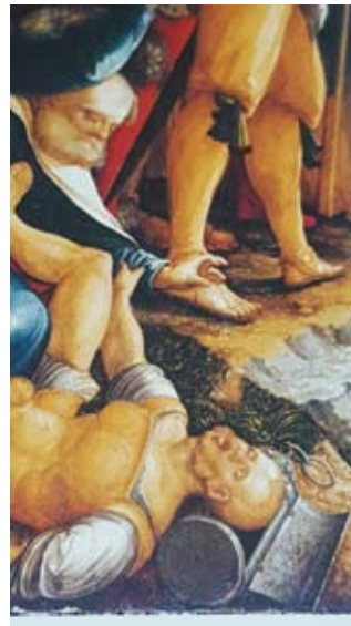
Der von Petrus bedrohte Knecht ist in seine Laterne gestürzt.

Meisterwerke der Fürstenbergsammlungen Donaueschingen in der Staatsgalerie Stuttgart. Ostfildern-Ruit, Hatje Cantz, 2002