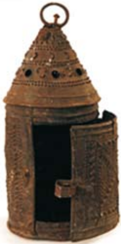
Bild 1: Blechlaterne, 1. Hälfte 16. Jahrhundert, Kelnhof-Museum Bräunlingen, Altbestand.

Diese Laterne war ein Gebrauchsgesamt und gerade ihre starken Abnutzungsspuren, Rost und eine dicke Wachsschicht im Innern, lassen erkennen, dass sie lange treue Dienste geleistet hat. Hergestellt hat sie ein Laternenmacher , ein Berufsstand, den auch Jost Amman in seinem 1567 in Frankfurt am Main erschienen Ständebuch dargestellt hat. Die Verse, die die Tätigkeiten