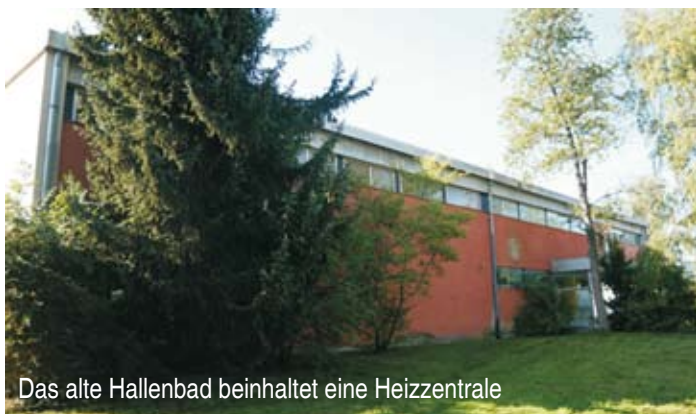
Das alte Hallenbad beinhaltet eine Heizzentrale